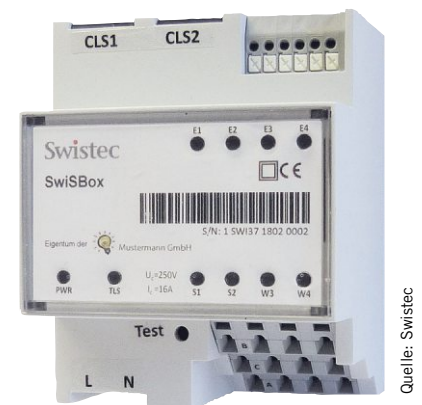
Bild 4: Die »Swisbox« wurde entsprechend den Anforderungen des FNN-Lastenheftes entwickelt