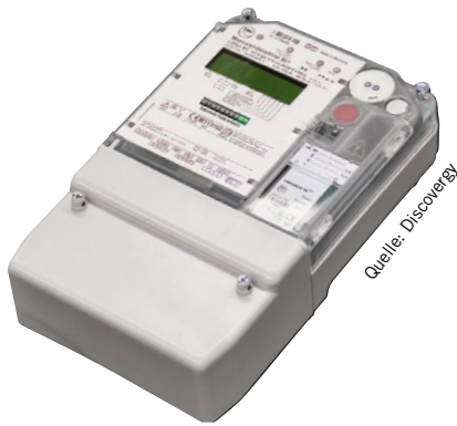
Bild 5: Digitale Stromzähler ergeben zusammen mit einem Kommunikations-Gateway ein Messsystem zur gerätespezifischen Verbrauchserkennung

lässigkeit auch bei niedrigen Spannungen und Strömen. Das Hutschienen-Element ist 72mm breit.