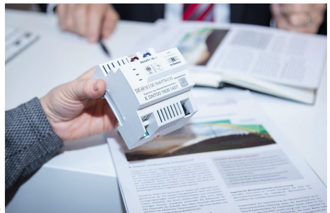
Bild 1: Das Interesse an Erläuterungen zum Messstellenbetriebsgesetz und den Dienstleistungen von Kiwigrid war beträchtlich