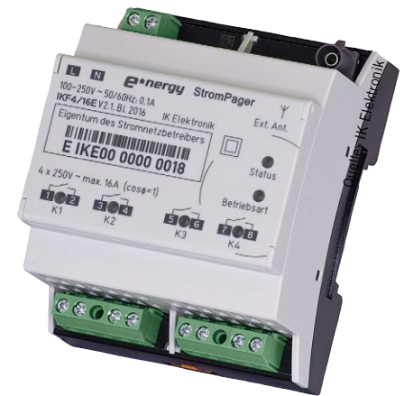
Bild 3: Der »Strompager« macht die funkbasierte digitale Steuerung des Stromnetzes möglich

Ergänzend zu dem beschriebenen klassischen Strompager-System wurde auf der Messe auch eine neue Variante der Steuerbox (»Strompager DX«) vorgestellt, welche die nahtlose Integration in das intelligente Messsystem ermöglicht. Dazu besitzt die Steuerbox Strompager DX eine CLS-Schnittstelle, welche mit dem Smart Meter Gateway (SMGW) verbunden wird. Es stehen dadurch zwei Kommunikationswege zur Verfügung – die WAN-Kommunikation über das SMGW und die Kommunikation über das Funkrufnetz mit dem e*Nergy-Protokoll. Der Grund für diese duale Architektur ist, dass eine gleichzeitige Ansteuerung von einer sehr großen Zahl von Steuerboxen (10000 und mehr) allein mit der WAN-Kommunikation des SMGWs technisch nicht zuverlässig machbar ist. Auf der anderen Seite ist die Kommunikation über das SMGW wiederum sehr gut geeignet für zeitungskritische Rückmeldungen und Statusinformationen sowie als redundante »Rückfallebene« für die Übermittlung von Steuerbefehlen. Für die einzelnen Aufgaben steht damit jeweils der optimale Kommunikationsweg zur Verfügung. So wird eine Verfügbarkeit und Zuverlässigkeit erreicht, wie sie mit herkömmlichen Steuerungslösungen nicht möglich ist.